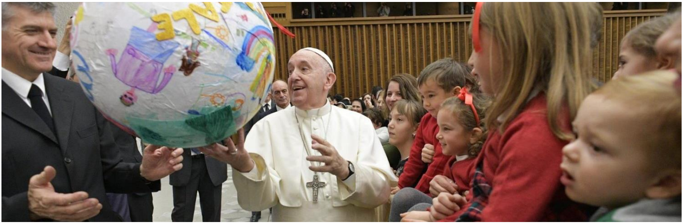
Foto de la felicitación de Navidad de hace tres años a los empleados vaticanos, reunidos con sus familias en el aula Pablo VI, el Papa lo resumió con una palabra: sonrisa. Un ejemplo es nuestra actitud frente a un bebé al que de inmediato le sonreímos, y cuya sonrisa nos da una enorme emoción que es signo de sencillez y pureza.

“Y esto ocurrió en una manera única entre María y José, y Jesús. La Virgen y su esposo, con su amor, hicieron surgir la sonrisa en los labios de su niño apenas nacido. Y cuando esto ocurrió, sus corazones se llenaron de una nueva alegría, venida del Cielo. Jesús es la sonrisa de Dios, porque vino a darnos el amor del Padre. Su mensaje fue acogido por María y José que han reconocido en su sonrisa la misericordia de Dios para ellos y para todos aquellos que esperaban al Mesías.